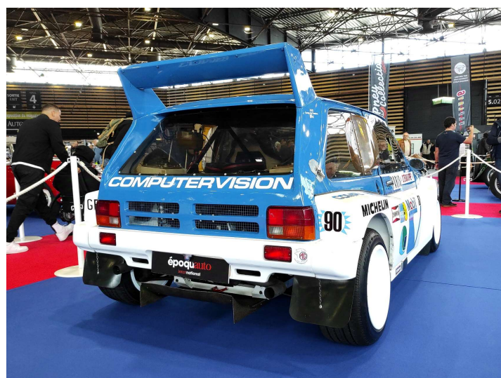
Austin Metro 6R4 - 1985