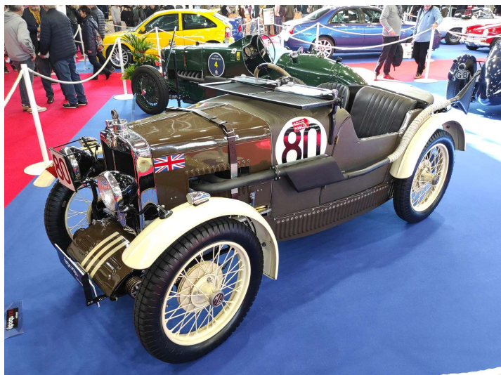
M.G. M 12/12 (Double Twelve) - 1930

Le succès d' Epoqu'Auto ne se dément pas, preuve en est l'interminable bouchon à l'ouverture le vendredi, du jamais vu au dire des organisateurs. Les passionnés venus en nombre avaient à cœur de découvrir un plateau d'une grande diversité qui n'avait d'égale que sa richesse. Cette année, parmi les très nombreuses commémorations, nous fêtons le centenaire de M.G. Dès ses débuts, la marque britannique s'est distinguée par ses modèles sportifs alignés sur les plus grandes courses. De nombreux exemplaires et pas des moindres agrémentaient l'exposition à Lyon.