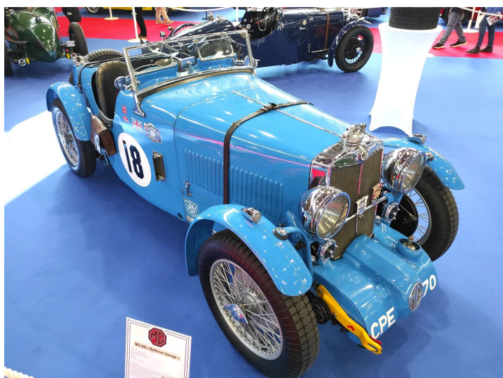
M.G. NA « Bellevue Garage » - 1935