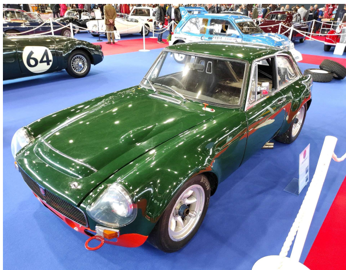
MGC GT Sebring - 1967