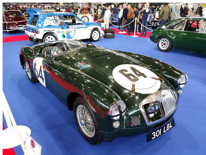
MGA Le Mans - 1955