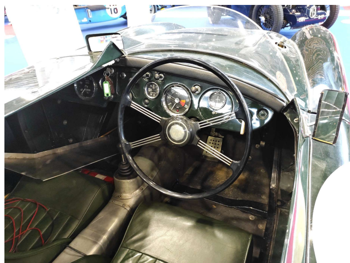
Planche de bord de la MGA Le Mans - 1955